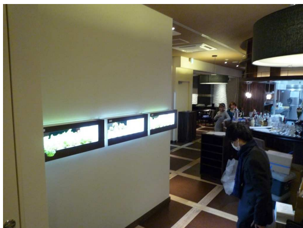
Samurai Cafe 渋谷道玄坂店に3台納入された『箱庭栽培』