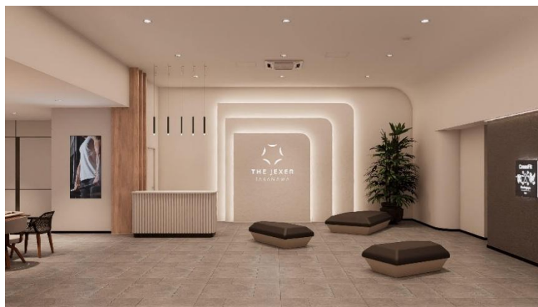
エントランスイメージ