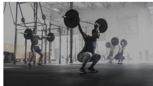
クロスフィットイメージ

クロスフィットとは、日常生活の動作（歩く・走る・持ち上げる・押す・引く・跳ぶなど）をベースに、それぞれを万遍なくトレーニングすることで“ 基礎体力の向上や生活動作が楽になる ”を 実感できるトレーニング方法 です。日常生活における動作のパフォーマンスと全身の機能向上を目的としたトレーニングはファンクショナルトレーニングと呼ばれ、毎回異なったトレーニングを高い運動強度で行うクロスフィットは 最も効率良く全身を鍛えることができます 。発祥の地アメリカでは消防・警察・軍隊などのトレーニングに取り入れられたのをきっかけに多くの人々に支持されています。