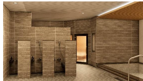
女性スパエリアイメージ

テーマは「 Beauty & Recovery（ビューティー&リカバリー） 」。ジェットバス、人工炭酸泉でゆったりと身体を温め、やわらかな蒸気に包まれるスチームサウナで日常の緊張から心と身体を解きほぐします。さらに、休憩スペース、スクラブやボディミルクの使用が可能なセルフメンテナンスブースなどのゾーンをご用意しております。