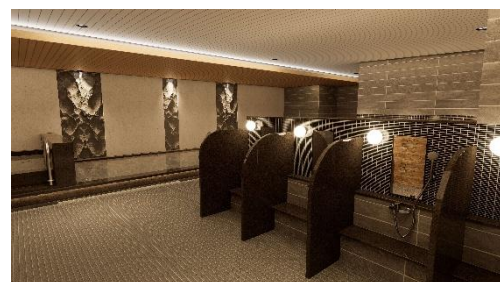
男性スパエリアイメージ

テーマは「 Sauna×Mindfulness（サウナ×マインドフルネス） 」。ジェットバス、人工炭酸泉で身体と心をほぐし、ドライサウナでは熱と静寂に身をゆだね、自身の呼吸と感覚に意識を集中させる時間をお楽しみいただけます。温まった身体を水風呂で引き締め、休憩スペースでは温冷交代浴の効果で自律神経を整え、思考をクリアな状態に導きます。