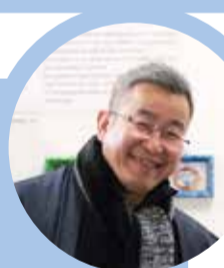
海洋プラスチックごみの アップサイクルブランド buoy