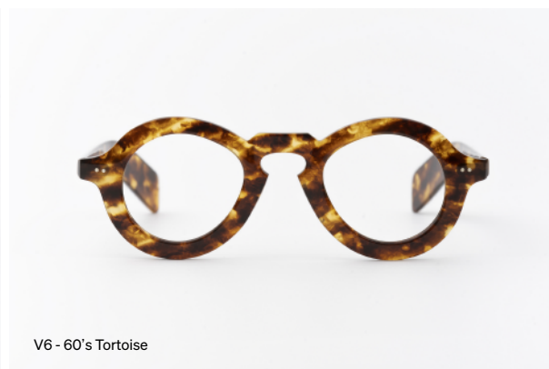
V6 - 60's Tortoise