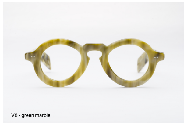
V8 - green marble