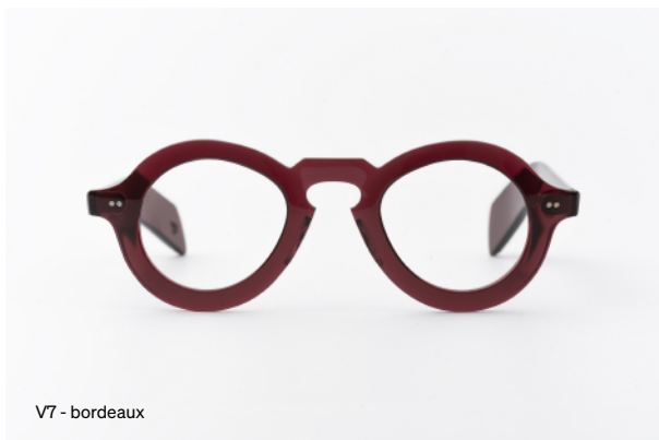
V7 - bordeaux