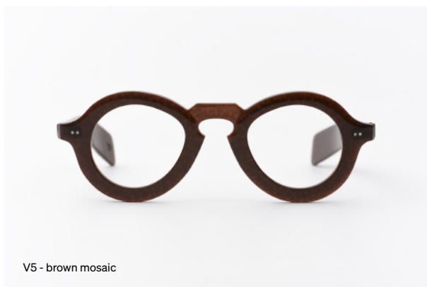
V5 - brown mosaic