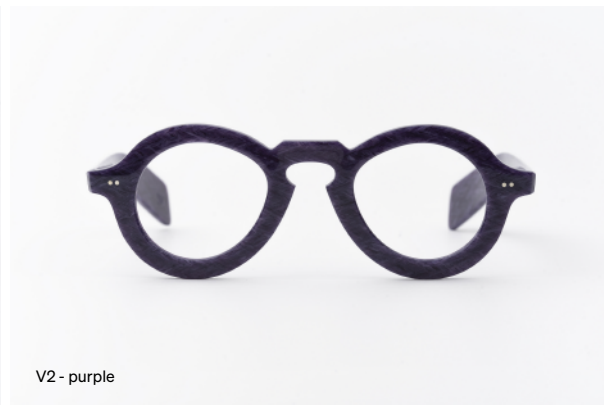
V2 - purple