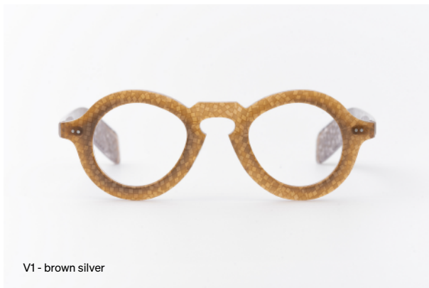
V1 - brown silver