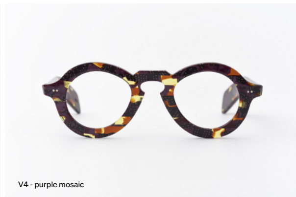
V4 - purple mosaic