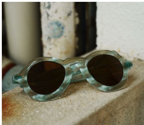
Jimの原型となった40年代フランスのヴィンテージフレーム

かつて存在したシルエットや質感を甦らせるため、ブランドチームは長年にわたりデッドストックのヴィンテージアセテートを探し求め、その希少な素材を基に現代的なスタイルを実現。過去と現在を繋ぐこの新作は、時代を超えた美しさを求める方々に最適なアイウェアです。