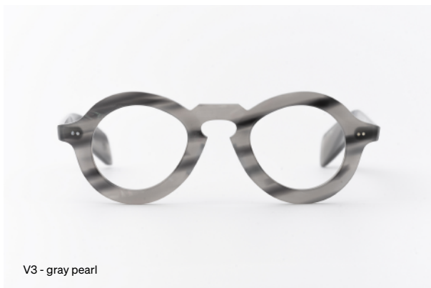
V3 - gray pearl