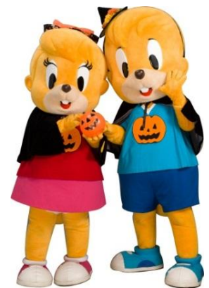
【仮装したララ(左)とドンチャック(右)】