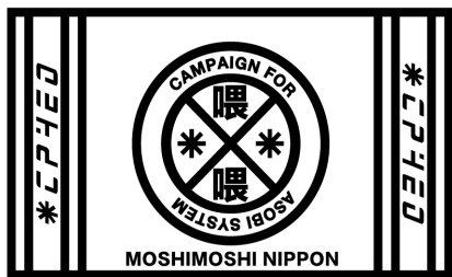
プロジェクトロゴ CAMPAIGN FOR MOSHIMOSHI NIPPON