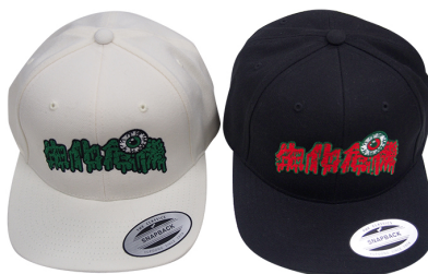
生化危機CAP (白黒) ¥4,500(税)