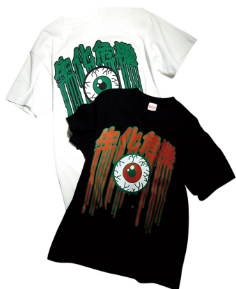
生化危機T SHIRT (白黒) ¥4,500(税)