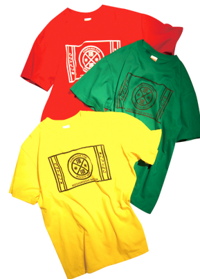
LOGO T SHIRT (赤緑黄) ¥4,000(税)