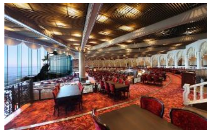
開業当初から受け継がれるシアターレストラン

そして 2025 年に“数え年で昭和 100 年”という節目を迎えることを記念し、館内の随所で親しまれてきた“ポセイドン”のイラストをモチーフにロゴを作成しました。ホテルニューアカオの海にせり出した特徴的な建築技法や、豪華客船をイメージしたデザインを象徴する海の神“ポセイドン”のマントに「昭和 100 年」の文字をあしらい、節目の年を熱海の観光と共に盛り上げてきました。