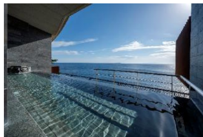
スパリウムニシキ