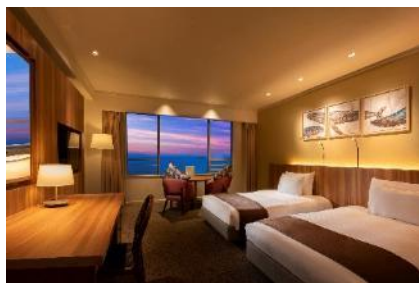
デラックスツイン