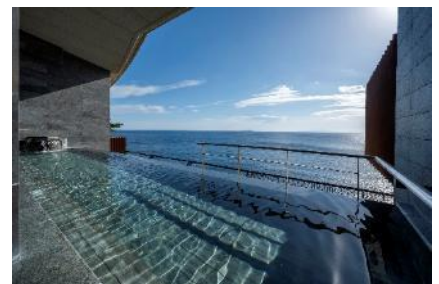
スパリウムニシキ