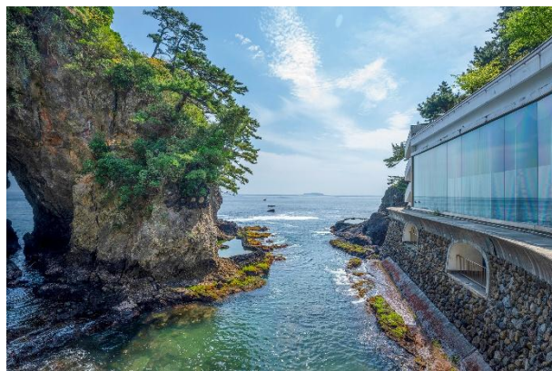
弧を描くような曲線のガラス窓から一段下がった「メインダイニング錦」の屋外部分に新エリアは誕生