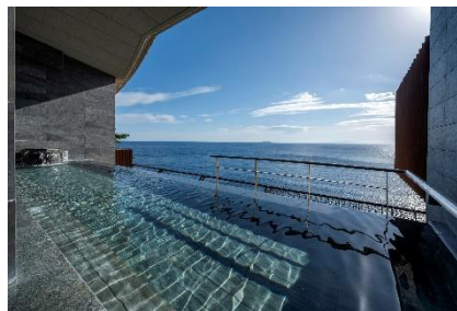
スパリウムニシキ