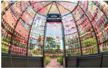
「チューリップ四季彩館」