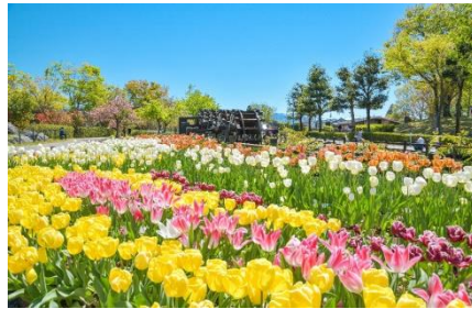
「五連用水水車とチューリップ」