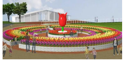
下：「円形花壇」※イメージ