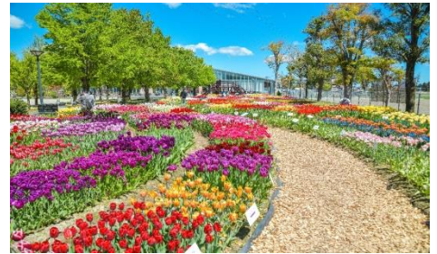
「彩りガーデンと四季彩館」