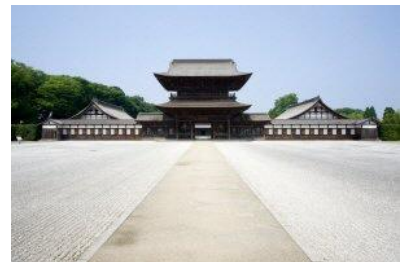
▲国宝 瑞龍寺(富山県高岡市)