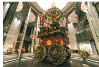
▲高岡御車山会館(富山県高岡市)