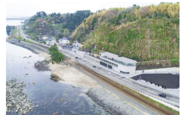
▲道の駅雨晴(富山県高岡市)