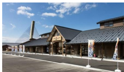
▲道の駅氷見・ひみ番屋街(富山県氷見市)