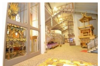
▲飛騨古川まつり会館(岐阜県飛騨市)