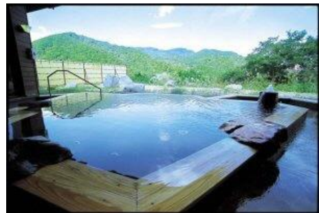
▲天竺温泉の里(富山県南砺市)