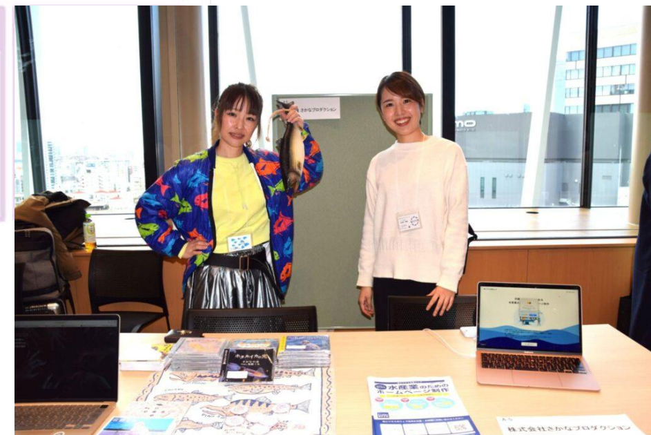
ブースイメージ（第1回 魚ビジネス EXPOでの1例）