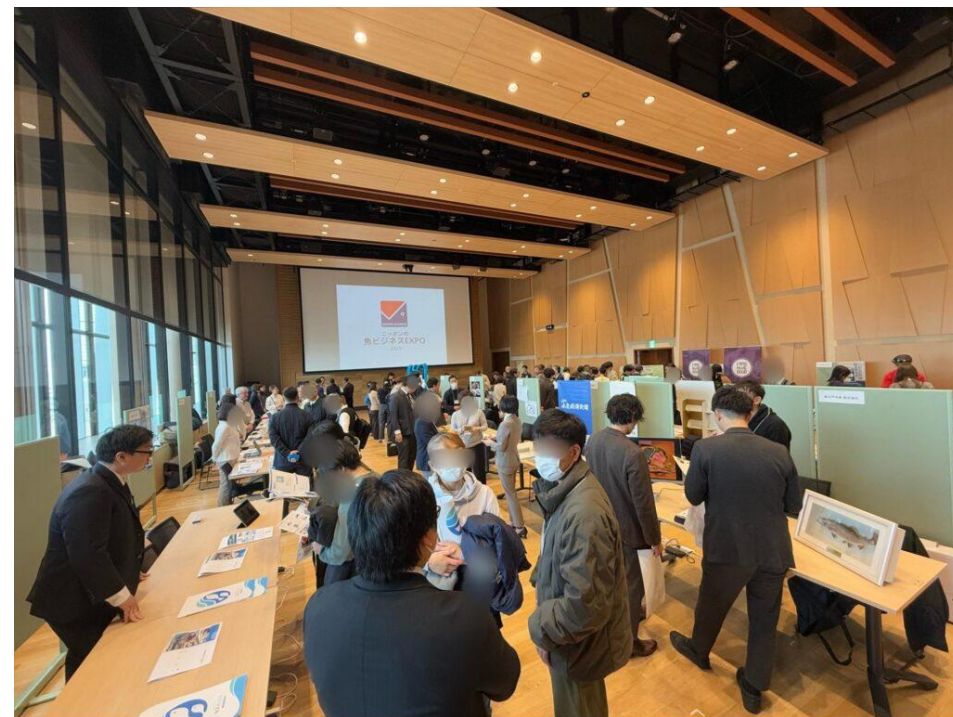
実施イメージ（第1回 魚ビジネスEXPO2025 2025/2/28）