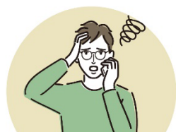
トラブル発生! *2 まずは下記へお電話を。

本サービスは、定額のサービス利用料金をお支払いいただくことで、ホームサーブが選定した身元や実績の確かな修理業者の手配から、通常の修理費用の支払いまでのお客さまの負担を一気通貫でカバーする、いわゆる「サブスクサービス」です。ご自宅の設備故障への見積もり、修理業者の選定等に対するお客さまの不安を、本サービスが解消します。