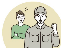
地元の修理作業員が ご自宅へ伺います!