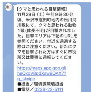
クマ目撃情報の発信(市公式LINE)