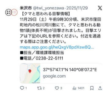
クマ目撃情報の発信(X)