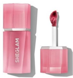
Like A Feather