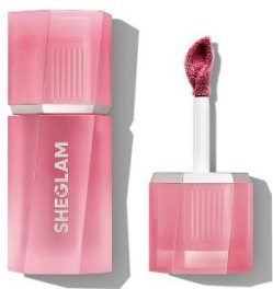
In The Clouds