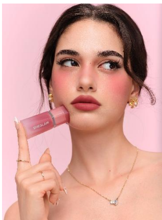
In The Clouds