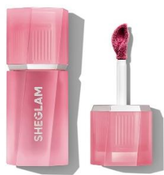
Flit & Float