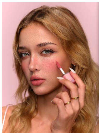
Like A Feather