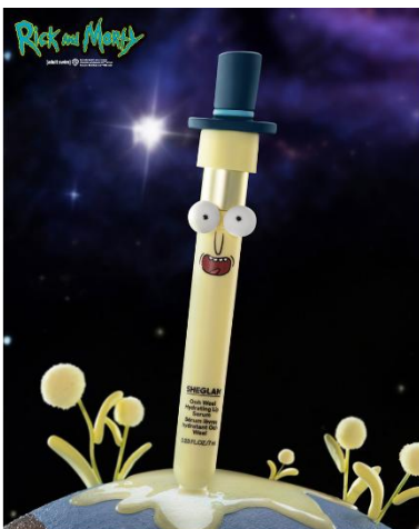
Ooh Wee! Hydrating Lip Serum

「Pickle Rick No-Rinse Hand Cleanser Spray」は、アルコールフリー処方のハンドクレンザー喷雾。手肌をやさしく整えながら、爽やかなキューカンバーの香りを楽しめます。