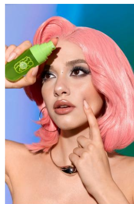
Portal Fuel Long-Lasting Jelly Primer