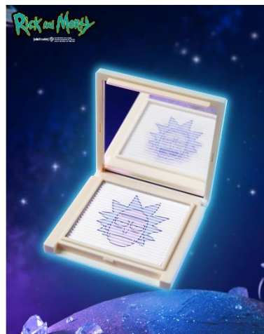
Mega Genius Setting Powder