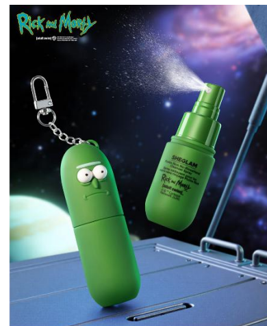
Pickle Rick No-Rinse Hand Cleanser Spray