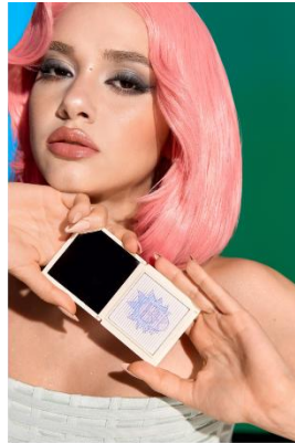
Mega Genius Setting Powder