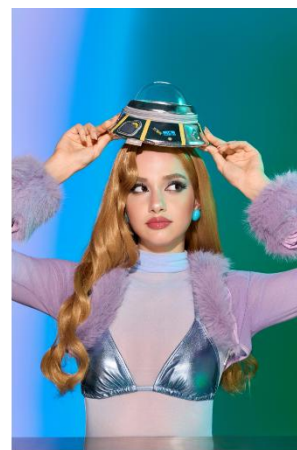
Space Adventure Makeup Bag