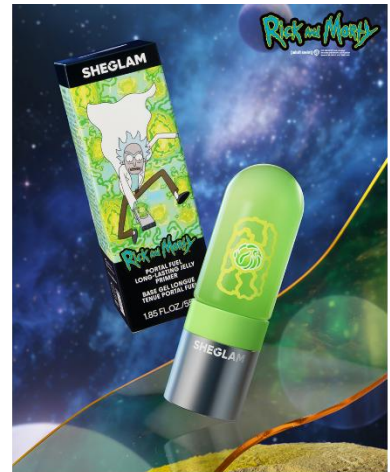
Portal Fuel Long-Lasting Jelly Primer

「Ooh Wee! Hydrating Lip Serum」は、ガラスのようなツヤ感とうるおい感を演出するリップセラム。軽やかな使用感で、なめらかな唇へ導きます。