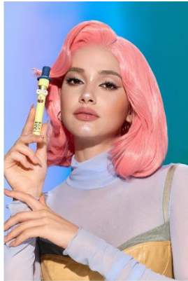
Ooh Wee! Hydrating Lip Serum