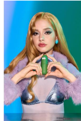
Pickle Rick No-Rinse Hand Cleanser Spray