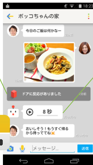
スマホ画面イメージ

iPhone アプリに加え、Android にも対応。より多くのご家庭でお使い頂けるようになりました。