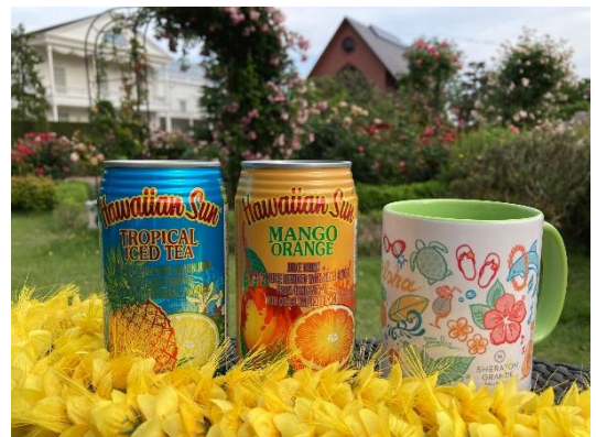
旅するイラストレーター、山代エンナ氏による オリジナルデザインマグカップ