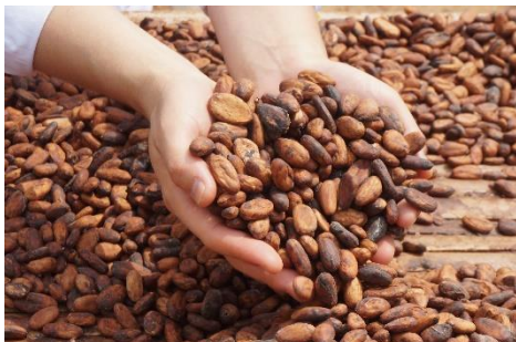
フェアカカオプロジェクト

持続可能な社会・環境の実現に貢献するため、事業活動を通じて取り組むべき重要課題を「食の安全・安心」「食と健康」「環境」「持続可能な調達」「従業員の能力発揮」の 5 つに整理しました。これらの課題に具体的に取り組むために、2028 年までに達成すべき目標として「ESG 中期目標」を設定しました。「持続可能な調達」では、主力製品であるチョコレートの主原料「カカオ豆」の課題を解決するために「フェアカカオプロジェクト」を進めています。農家の貧困や児童労働などカカオ豆生産地の様々な課題に積極的に取り組んでいます。