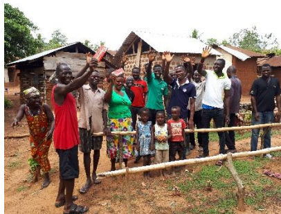
カカオ豆生産地にて

公式サイト: https://www.lotte.co.jp/corporate/