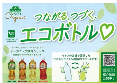
イオン店舗で回収した使用済みペットボトルを プライベートブランドで再製品化