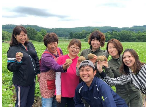
契約農家さんとフィールドマン