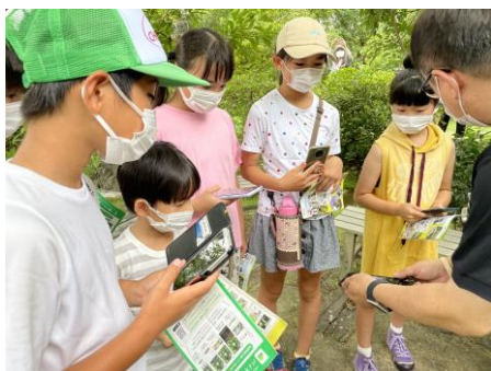
「イオンふるさとの森」に生息する 「いきもの調査」をお客さまと実施

新店舗が開店する際、店舗敷地内にその地域の環境に適した樹木を取り交えて植樹する「イオンふるさとの森づくり」や、貴重な資源を捨てずに再資源化するため、紙パック、食品トレイ、アルミ缶、ペットボトルを店頭で回収する取り組みを1991年から実施しています。また、自然資源の持続可能性と、事業活動の継続的発展の両立を目指すべく、自然・生態系・社会と調和のとれた持続可能な商品の調達に努めるなど、サプライチェーン全体で環境・社会課題の解決に取り組んでいます。