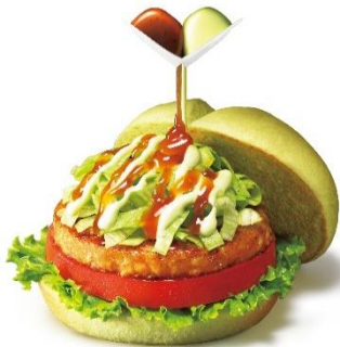
主要原材料に動物性食材不使用のバーガー 「グリーンバーガー<テリヤキ>」

またモスグループでは、SDGs の 17 の目標の達成を目指すとともに、独自の目標として、当社の基本方針にある「心のやすらぎ」「ほのぼのとした暖かさ」を世界の人々に広げていくことを目指しています。