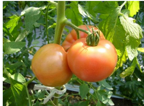
モスの生野菜は国産。農家さんの想いが見える野菜です。