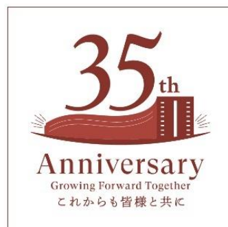
開業 35 周年ロゴ

35 周年を記念して「Growing Forward Together これからも皆様と共に」をテーマにロゴマークをデザインしました。このテーマには、これからも明るい未来に向かってずっとお客様と一緒に歩んでいきたいという想いが込められています。また、お祝いムードを盛り上げていきたいという気持ちから、ロゴの色には存在感のある赤を使用し、象徴的なホテルのシルエットをモチーフにいたしました。