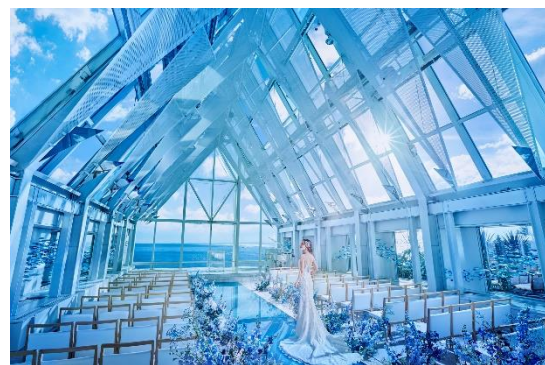
クリスタルチャペル