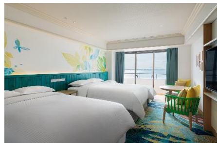
※トレジャーズルーム 客室イメージ