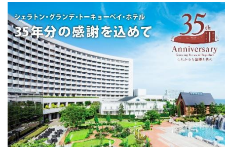
※イメージ モザイクアート完成図

◆公式 Instagram URL： https://www.instagram.com/sheratontokyobay/