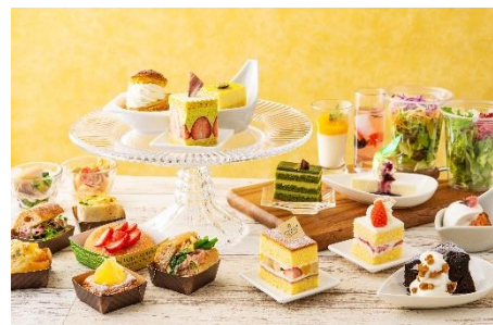
※フライデースイーツbuffet イメージ