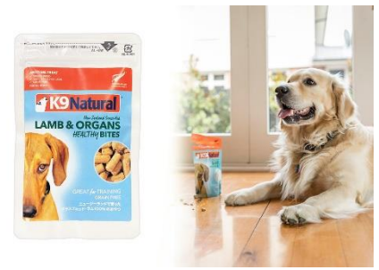
K9 ナチュラル ラム・トリーツ

犬の心身の健康を守る最良の食事を提供したいという思いから生まれたドッグフードブランド「K9 ナチュラル」とコラボレーションし、自然豊かなニュージーランドのグラスフェッド・ラムのみを特殊な製法でフリーズドライにした肉 100%のおやつ「K9 ナチュラル ラム・トリーツ」をドッグフレンドリールームご宿泊のお客様へ期間限定でプレゼントいたします。