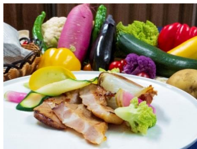
< ランチセットイメージ >