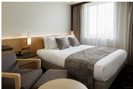
<モデレートクイーン>