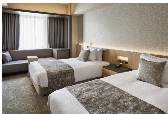
<スーペリアツイン>