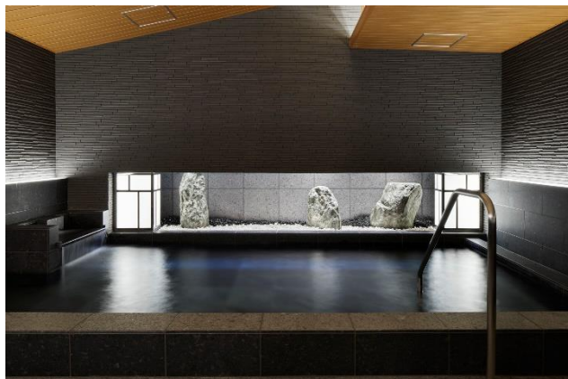
< 大浴場 >