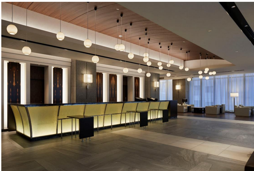
<フロント・ロビー>

『ホテル JAL シティ札幌 中島公園』では、ホテル JAL シティのブランドコンセプトである「Smart simplicity (最先端のシンプルシティ)」をご体感いただけるよう高機能なサービスを用意し、限られた時間を有意義に過ごしたいというお客様のニーズにお応えしてまいります。また大浴場も併設しており、旅先での疲れを癒す、快適かつ心地よいご滞在を提供いたします。