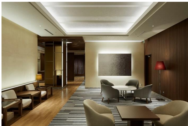
< スパラウンジ >

営業時間 15:00～25:00／05:30～10:00（ご宿泊のお客様のみご利用可能）