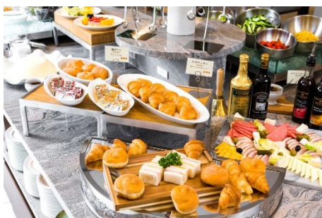
< 朝食イメージ >