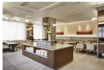
< 「Cafe Contrail」内観 >

また、ランチタイムは「グルメクルージングランチ」として、全国津々浦々のご当地メニューをサラダバー・ドリンクバー付きのセミブッフェスタイルにて提供いたします。天井には折り紙天井を配し、広い空間にメリハリを持たせ、ブッフェカウンターには天然御影石を使用することで、清潔感あふれる上質な店内になっています。