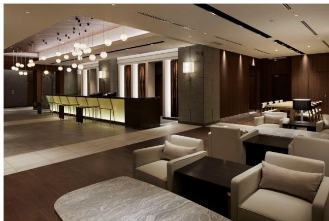
<ラウンジスペース>