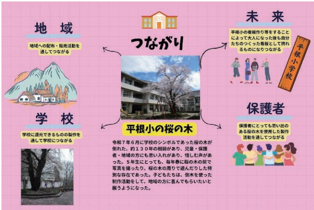
「未来につながる桜プロジェクト」の企画書より抜粋