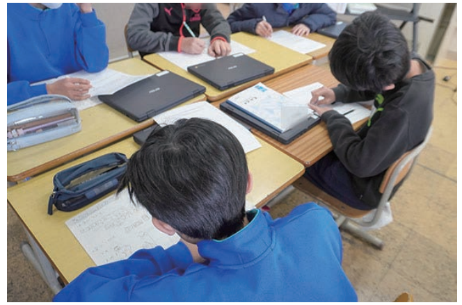
グループワークに取り組む様子