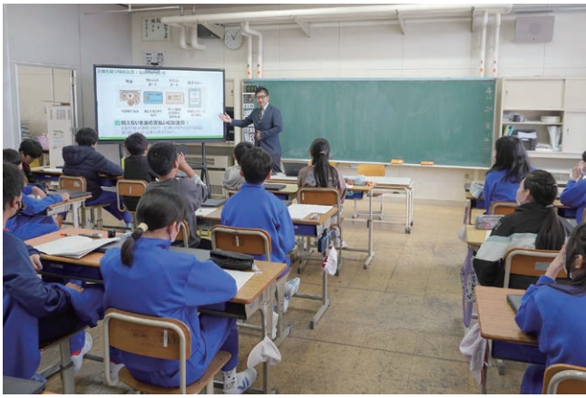
平根小学校6年生への授業の様子