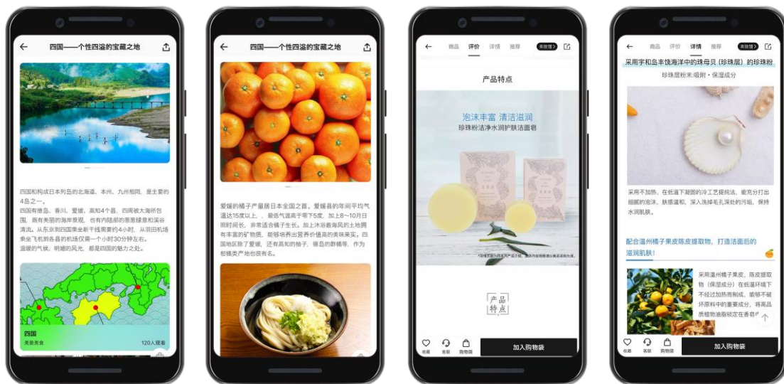
四国 4 県を特集した「四国館」 ページイメージ