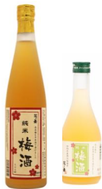
花の舞純米梅酒 500ml 300ml