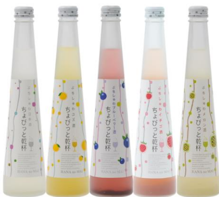
ちょびっと乾杯ぶちしゅわシリーズ 各 300ml 左から日本酒、ユズ、ブルーベリー、イチゴ、メロン