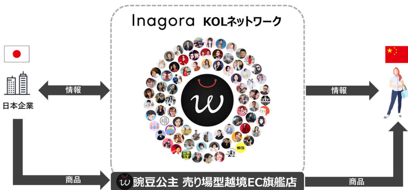
(図 1) KOL ネットワークの概略図

従来の EC プラットフォームとは異なり、「抖音(Douyin)」EC プラットフォームで販売するには、KOL による紹介が販売促進に不可欠な手法となります。そこで、図 1 のような KOL ネットワークの活用が有力な選択肢となり得ます。また、日本商品の販売のみならず、マーケティング・ブランディング活動の領域においても、サポートさせていただきます。