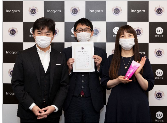
豌豆大賞授賞式の様子

(左上より、マルニチロ株式会社様、山本漢方製薬株式会社様、株式会社アートネイチャー様)