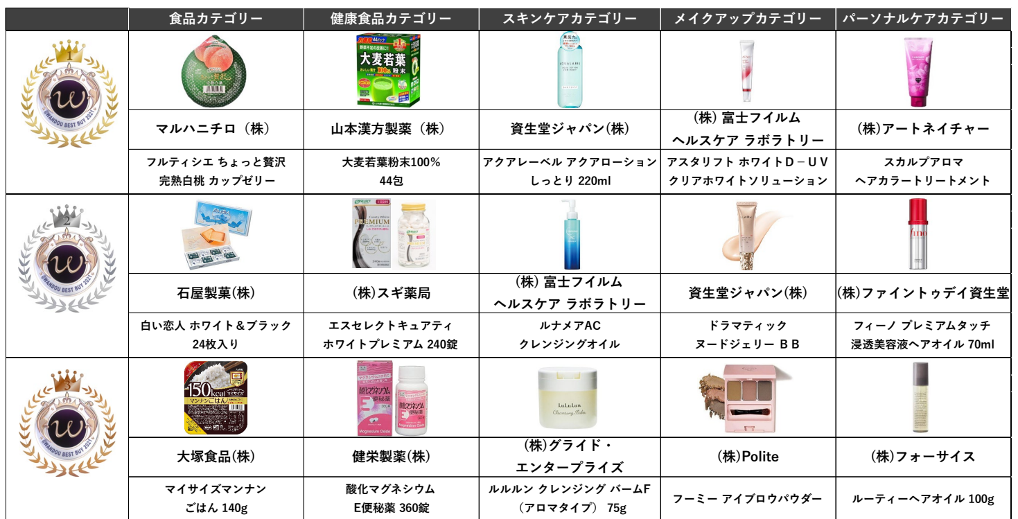
豌豆 (ワンドウ) 大賞「WANDOU BEST BUY 2021」受賞商品一覧