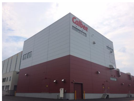
「フルグラ」生産拠点の北海道工場