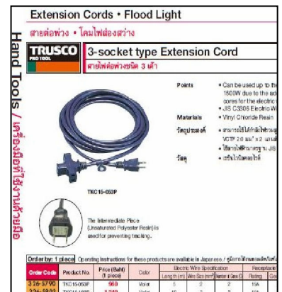
↑タイ語と英語で商品情報を掲載

（プロツールナカヤマ(タイ)株式会社に在庫があるもの、タイ国内メーカーから商品を取寄せるもの、日本から商品供給するものを色分けしています。）