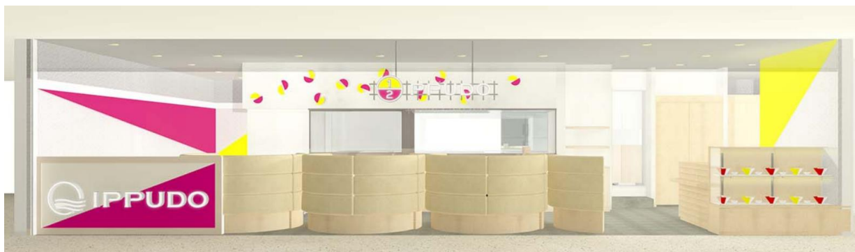
1/2PPUDO 渋谷ヒカリエ店 外観イメージ

オープンを記念して、2019年1月22日（火）～1月28日（月）の期間、お食事をご注文のお客様にソフトドリンク1杯を無料で提供いたします。