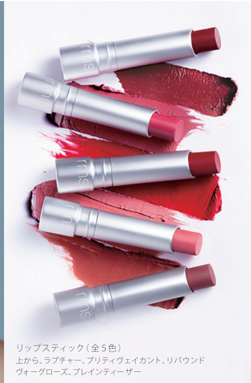
リップスティック(全5色) 上から、ラブチャー、プリティヴェイカント、リバウンド ヴォーグローズ、ブレインティーザー

天然成分が肌に栄養を届け、内側から輝き出すような美しさを引き出すメイクアップを提案する rms beauty (アールエムエス ビューティー)から、2018年3月ブランド初となるリップスティック(全5色)が登場します。