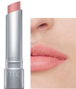
vogue rose ヴォーグローズ モードかつフレッシュな ローズコーラル