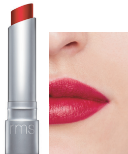
rebound リバウンド 意志の強さを感じる ルビーレッド