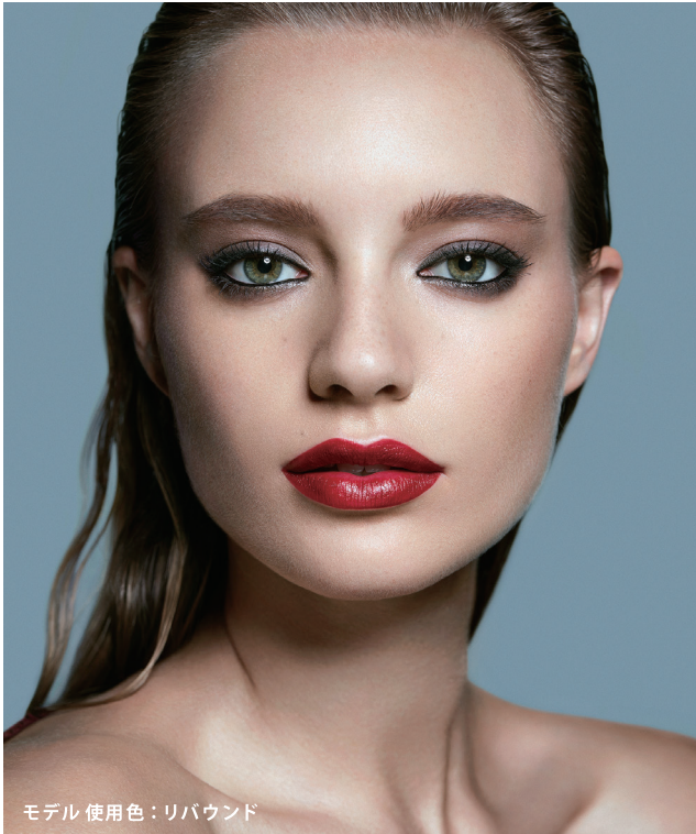
モデル 使用色：リバウンド