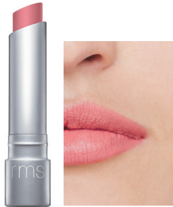
pretty vacant プリティヴェイカント 青みを含んだフェミニンな ドラージェピンク

滑らかなテクスチャーと唇にピタッと吸い付くような密着感が、パワフルで鮮やかな発色を実現。深みと輝きのあるなめらかなサテンマットに仕上がります。ミツロウやホホバオイル、プリティオイルなど植物由来の保湿成分を配合し、うるおいを保ちながら高発色をキープします。