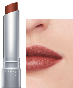
rapture ラブチャー 深みのある大人の ブリックレッド