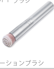
ファンデーションブラシ