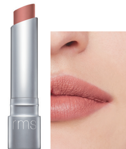
brain teaser ブレインティーザー ノーブルで繊細な ミディアムピンクブラウン