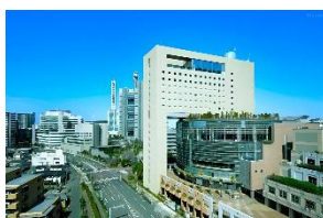
ザ マーク グランドホテル 会場まで徒歩で約 10 分