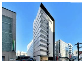
レフ大宮 by ベッセルホテルズ 会場まで車で約 5 分