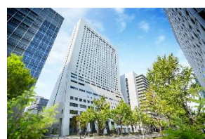
ホテル日航大阪 心斎橋駅直結 会場まで電車で約 15 分