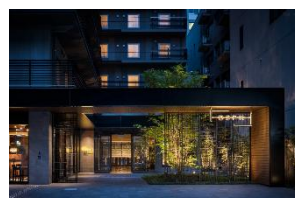
ビスポークホテル心斎橋 会場まで車で約 5 分