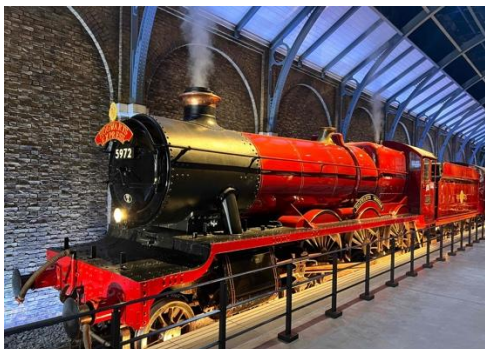
ワーナー ブラザース スタジオツアー東京 — メイキング・オブ・ハリー・ポッター Warner Bros. Studio Tour Tokyo – The Making of Harry Potter.

本プランでは、移動と観光を一体で楽しめる体験の提供を目的に、「東京スカイツリー」および「ワーナー ブラザース スタジオツアー東京 — メイキング・オブ・ハリー・ポッター」といった、国内外から高い支持を集める人気観光スポットを対象施設としています。