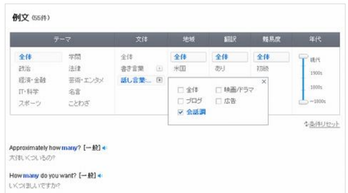
例文絞り込み画面