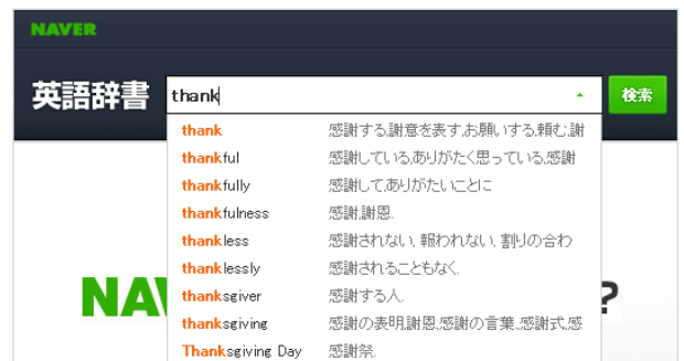
検索ウィンドウ上のサジェスト表示