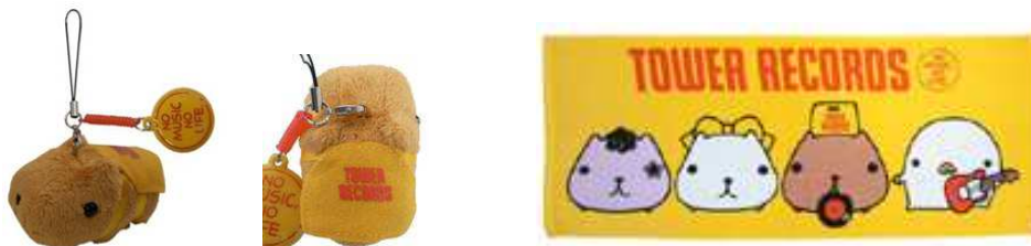
マスコットクリーナー～エプロン～ ¥693(税込)