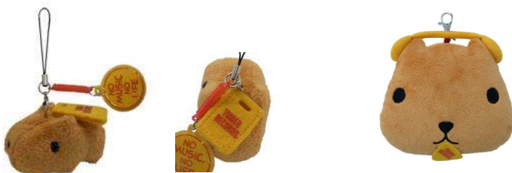
マスコットクリーナー～ショッピングバッグ～ ¥693(税込)