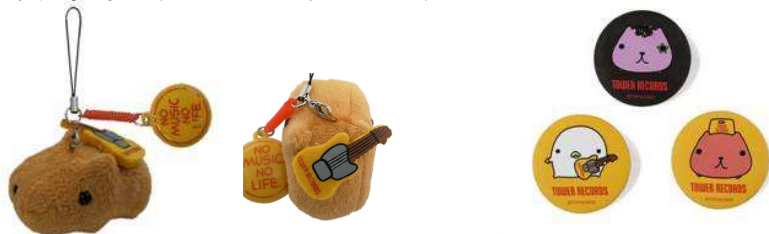
マスコットクリーナー～ギター～ ¥693(税込)