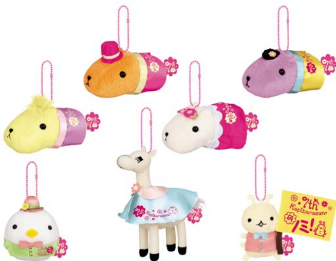
「カピバラさん カバンに付けられるぬいぐるみ ～ふんわりフラワ～ン The 7th Anniversary～」