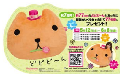
【おっきな顔型ぬいぐるみ】

対象商品：「カピバラさん でっかいころりん顔型クッション ～ふんわりフラワ～ The 7th Anniversary～」