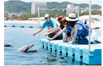
海でのイルカトレーナー体験(イメージ)