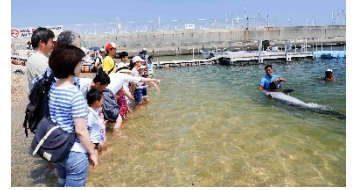
浅瀬でイルカウォッチング(イメージ)