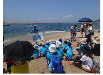
海辺のイルカ学習会(イメージ)