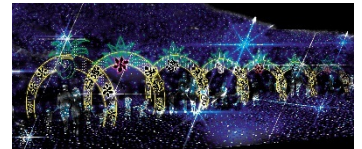
Aloha!!イルミネーション(イメージ)

ハワイをイメージした夏限定のイルミネーション。サンセットにあわせて点灯するイルミネーションは、光と音のビックウエーブと光を体感できるパインロードや毎晩打ち上がるイルミネーション花火など見どころ満載です。また、ハワイアンナイトを盛り上げるフラダンスイベントなども開催します。