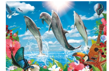
イルカワイライトライブとプロジェクションマッピング(イメージ)

パンケーキやトロピカルドリンクなどを提供するハワイアンフードブースや物産ブースをはじめバーベキューやビアガーデンがオープンします。