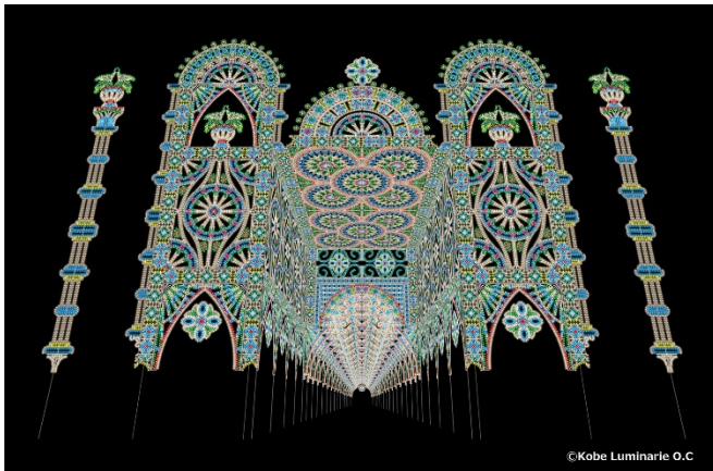
フロントーネ・ガレリアコペルタ(デザインビジュアル)

本年10月には日本新三大夜景にも選ばれ、宝石を散りばめたような“1000万ドルの夜景”を誇る神戸の街が、さらに光り輝く10日間。この時期の神戸にぜひご注目ください。