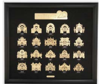
■30,000円寄付によるギフト 20thメモリアルプラーク(ネーム入り)

<「ジャパングビング」とは ( http://japangiving.jp/ )>