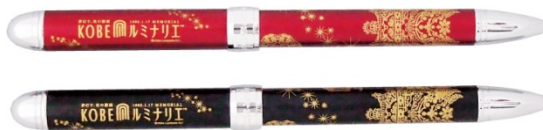
■10,000円寄付によるギフト 蒔絵ボールペン