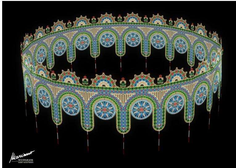
噴水広場のルミナリエ作品(デザインビジュアル)

会場となる東遊園地南側、噴水広場に設置される今年のルミナリエ作品では、音楽に合わせて点灯する光のショーが行われるなど、これまでにはない演出で、賑わいゾーンを創出します。