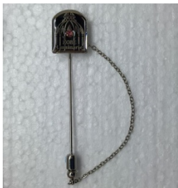
■3,000円寄付によるギフト オリジナルラベルペン