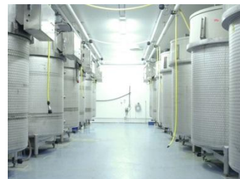
タンクでのヘマトコッカス藻培養。ヘマトコッカスが純粋に育ちやすいタンク内での培養技術を有しています。

大量培養で高品質のアスタキサンチンを得るためには、ヘマトコッカス藻の細胞内にアスタキサンチンを高濃度に生成させること、生育状況を揃えること、この二つを両立させることが非常に重要で、かつ、困難な課題でした。アスタリールは、長年にわたる経験と高度な技術、度重なる革新で、この両立を可能にする製法を確立しました。この高度な技術により、アスタキサンチンをたっぷり生成した状態のヘマトコッカス藻をそのまま凝縮して詰め込んだサプリメント、「赤いめぐみ」が誕生したのです。