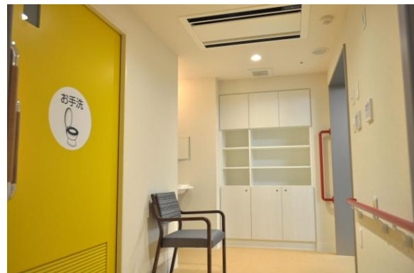
個別浴室内脱衣室

様々な世代が多様な暮らし方を実現して住み続けることができる『世代循環型』の街づくりを目指す「世田谷中町プロジェクト」では、超高齢社会の課題である「認知症」への取り組みを強化し、心地よい上質な暮らしと日々の健康をサポートすることで、将来の介護にも安心して人生を愉しむことのできる、シニアのための住まいづくりの実現を目指しています。