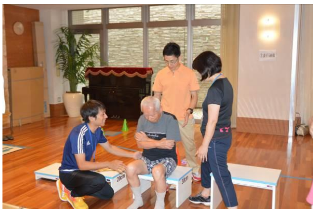
ロコモ予防プログラム実施の様子