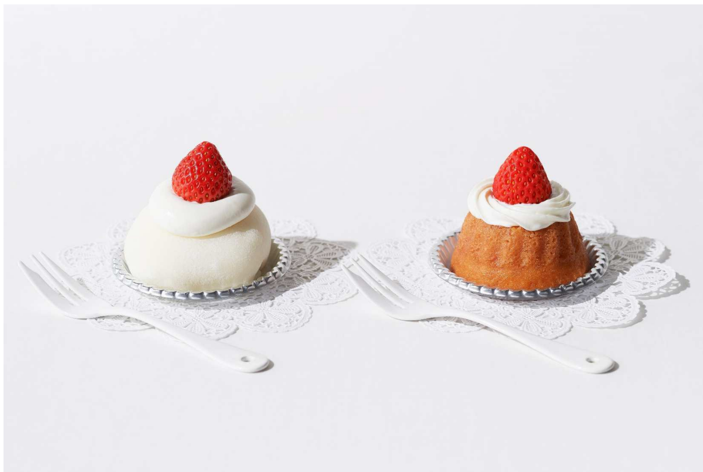
（写真左） いちご大福

表参道店では、ふだんを少し色付けてくれるような、いちごケーキ、いちご大福、いちごをたっぷりを使用した焼菓子をご用意しています。