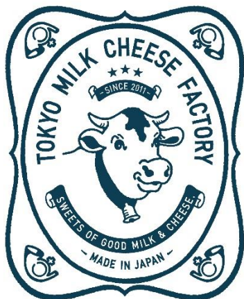
東京ミルクチーズ工場

厳選したミルク、良質のチーズ、お菓子職人たちが、日本中、世界中から集めてきた材料でこれまでにない自分たちにしか作れないお菓子を作りたい… 東京ミルクチーズ工場は、新しい材料の組み合わせをまいにち考え驚きとおいしいお菓子を提供する創造性あふれる工場をコンセプトにしています。