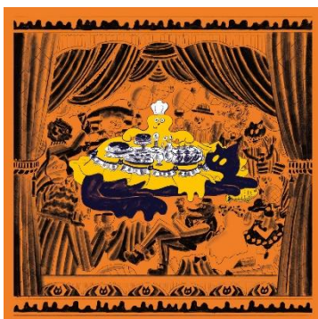
キャラメルガレットのメインイラスト