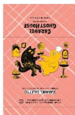
個包装② ふたりで打ち上げ。乾杯！