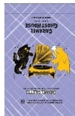
個包装③ ふたりでダンシング！ 楽しい夜は長い。