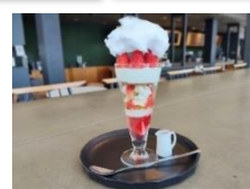
特別メニューの一例