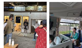
バスツアーの様子

[実施日] 2026年7月11日(土)「酒の郷佐久の地で愉しむ特別な日本酒旅」 7月18日(土)「ワインのまち小諸の地で楽しむ特別なワイン旅」 [参加方法] JR東日本のHP等で別途お知らせします。