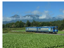
HIGH RAIL 1375