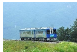
HIGH RAIL 1375

※詳細は株式会社 JR 東日本びゅうツーリズム&セールスよりお知らせします(6月上旬頃)。