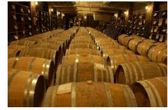
信濃ワイン 地下ワインセラー