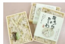
根曲がり竹おこわ