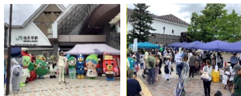
まるごとつながるフェスタ佐久平 (2025年)の様子

[開催日] 2026年9月12日(土)・13日(日) [場所] 佐久平駅及び佐久平駅蓼科口周辺 [内容] 駅業務体験、ミニはいれ～る運行、物販、 スタンプラリー、地元企業・自治体の出店、 地元の学校によるステージ発表などを予定