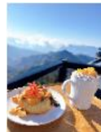
特別メニューの一例