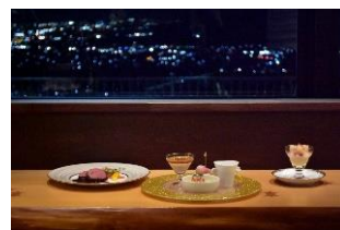
「更級の月」特別ディナー

TRAIN SUITE 四季島のために整備された姨捨駅ラウンジ「更級の月」で、日本三大車窓の一つとして知られる姨捨駅の絶景とともに、信州の食材を活かした特別ディナーを楽しめるイベントを発売します。