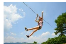
ジップラインの様子

※ご利用の際は、「斑尾高原」公式HP ( https://www.madarao.jp/zip/book ) で事前予約をお願いします。