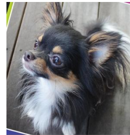
「ママどこー？」 お名前 Ralph 応募者ニックネーム Panazora