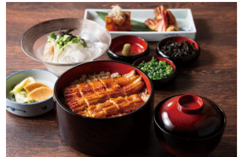
▲ランチひつまぶし御膳