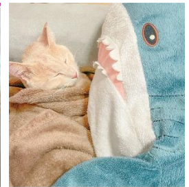
「友達と寝る子」 お名前 MOMI 応募者ニックネーム フリン