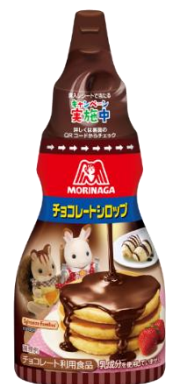
森永チョコレートシロップ