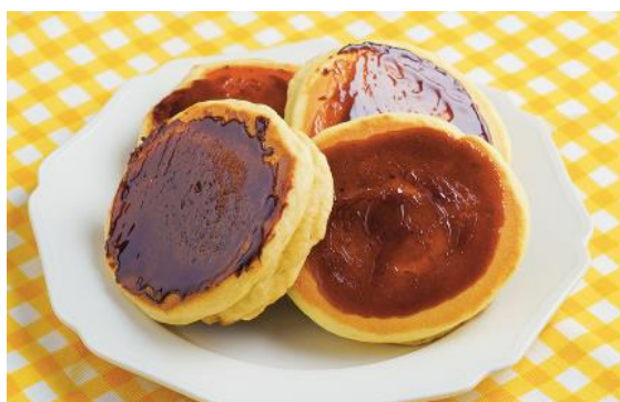
プリンでつくる！プリュレ風ホットケーキ