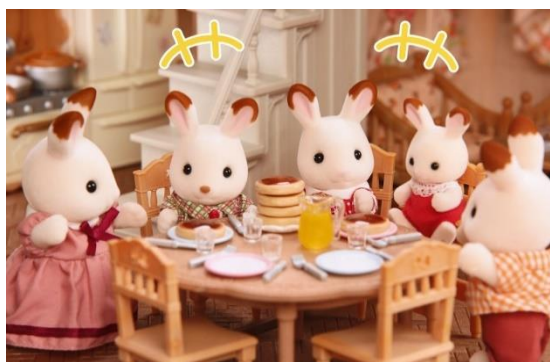
コラボレシピ動画

森永製菓では、レシピ動画サイト「DELISH KITCHEN」との協力により、「プリンでつくる！プリュレ風ホットケーキ」のレシピ動画を作成しました。卵は使わず市販のプリンを加えて、外はパリッ！中はもちっ！とした食感や見た目の非日常感をお楽しみいただけます。動画内では、「シルバニアファミリー」の人気キャラクターである“ショコラウサギファミリー”が登場します。“ショコラウサギファミリー”が可愛らしく動き出すファンタジーな世界観のコマ撮りと共にレシピ動画をお楽しみください。