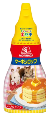
森永ケーキシロップ <メープルタイプ>