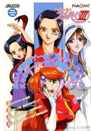
アイドル雀士 スーチーパイIII 1999年発売

キャラクターやコスチュームも新たに、変身・必殺技・脱衣シーンはフル画面のアニメーションに進化！