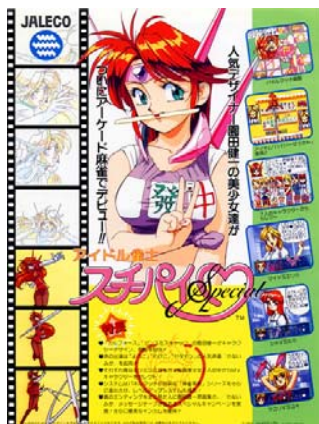
アイドル雀士 スーチーパイSpecial 1993年発売

アーケード版のデビュー作。7人のキャラクターから好みの1人を選び残りの6人および“真のボス”と対決する。