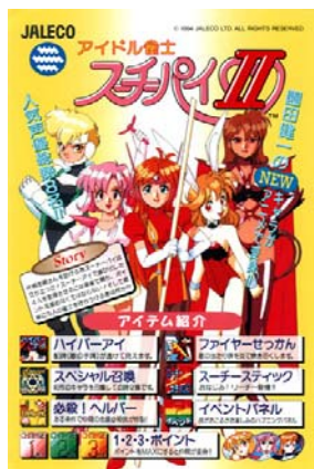
アイドル雀士 スーチーパイII 1994年発売

アーケード版のデビュー作。7人のキャラクターから好みの1人を選び残りの6人および“真のボス”と対決する。