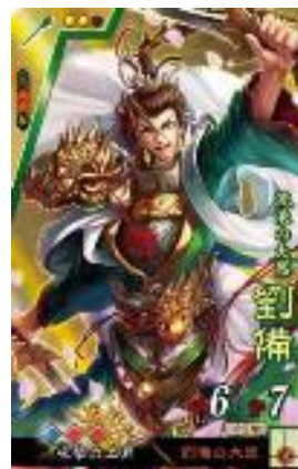
▲劉備 イラスト/ニシカワエイト