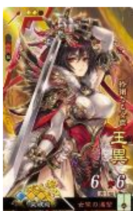
▲王異 イラスト/萩谷薫