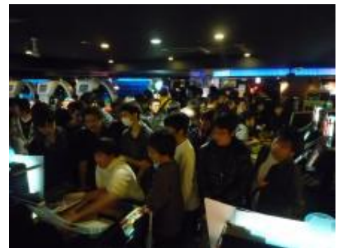
▲当時の盛況の様子

過去の『三国志大戦』では、イラストレーターを100名以上起用し、多彩なイラストで三国志の武将たちを描いたトレーディングカードは、多くのお客様を魅了しました。 その累計カード出荷枚数は5億枚以上となり、スマートフォンゲームを含め、現在のカードゲームのトレンドを生み出しました。