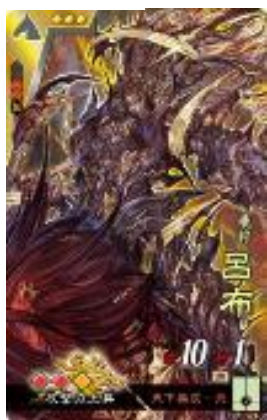
▲呂布 イラスト/風間雷太