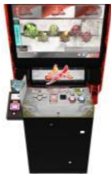
▲万能なターミナル 便利な機能が盛りだくさん！