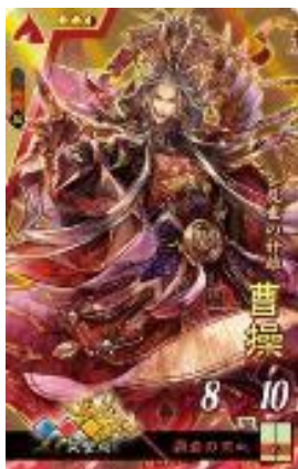
▲曹操 イラスト/まじ

カード裏面には、武将のプロフィールや計略の詳細等が記載されていて、コレクション性も高まります。