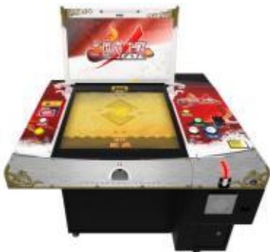
▲サテライト フラットリーダーで直感的に操作！