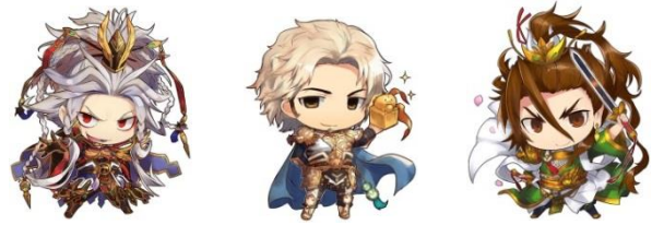
▲左から：ぷち曹操、ぷち孫堅、ぷち劉備