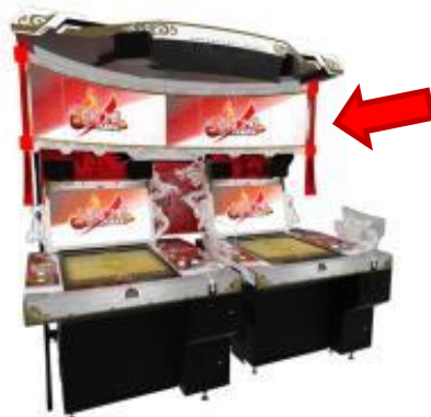
▲大迫力のライブスクリーン ギャラリーも楽しめる！