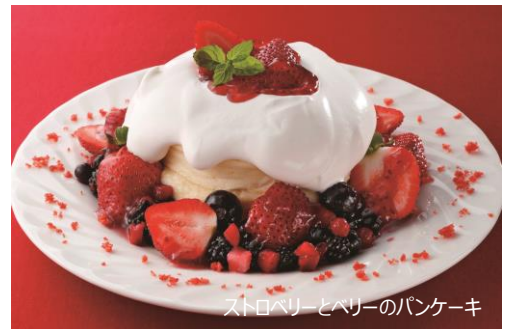
ストロベリーとベリーのパンケーキ

さかい珈琲は世界一のパンケーキを目指しております。クオリティーの高い人気の手作りパンケーキ。ご注文を頂いてからメレンゲと合わせてまったり感が人気の秘密です。