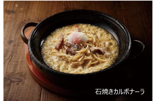
石焼きカルボナーラ

手作りのココットやさかい厳選の自信作サラダごはん、17時からプレミアムタイムとして石焼チーズリゾット、石焼カルボナーラなど夜だけの特別メニューもご用意いたします。