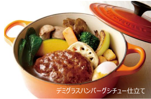
デミグラスハンバーグシチュー仕立て