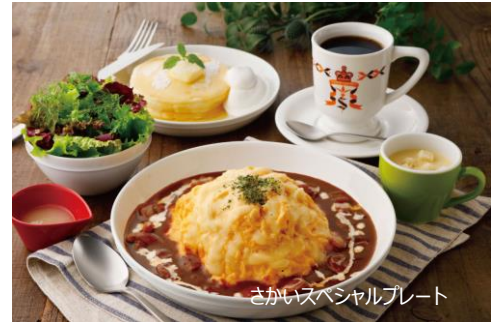
さかいスペシャルプレート